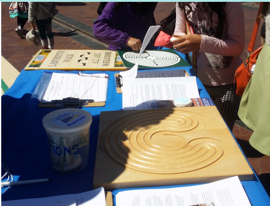
Раздаточные материалы, лабиринты пальцев, коробка для сбора, вывески - все это среди «дополнительных возможностей», которые некоторые хозяева любят приводить на прогулку.