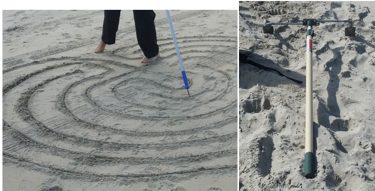
Hacer un laberinto en la arena con un mango de escoba y punta de metal, y una herramienta inteligente para hacer "surcos gemelos" hecha de dos paletas y un rodillo de pintura.