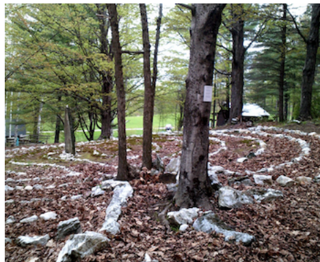
Los laberintos a menudo se sientan bien, si respetan, los árboles.

Dependiendo de los materiales que use para marcar el laberinto, el laberinto se puede hacer en terreno blando o duro, en el piso de un edificio o prácticamente en cualquier lugar. Intenta encontrar una superficie bastante plana si puedes, idealmente sin agujeros en el suelo. La superficie no tiene que estar limpia (por ejemplo, libre de hojas de árbol), siempre que pueda ver dónde marcar el camino.