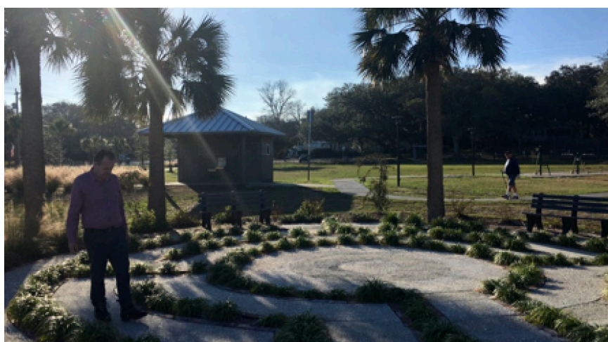
Un labyrinthe crétois.