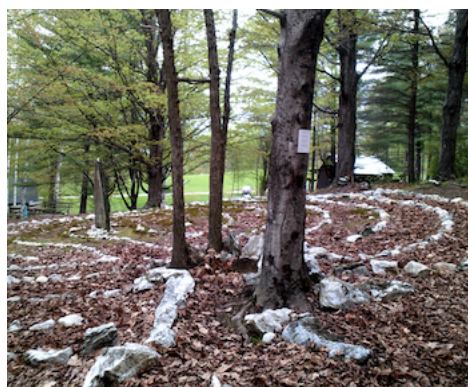
Les labyrinthes s'accordent bien avec les arbres, s'ils sont respectés