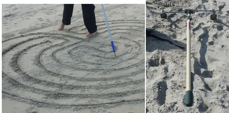
Создание лабиринта на песке с метлой и металлическим наконечником, а также умный инструмент для изготовления «двойной канавки», сделанный из двух шпателей и валика для краски..